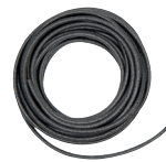
OTTOCORD PE-B2 Rundschnur